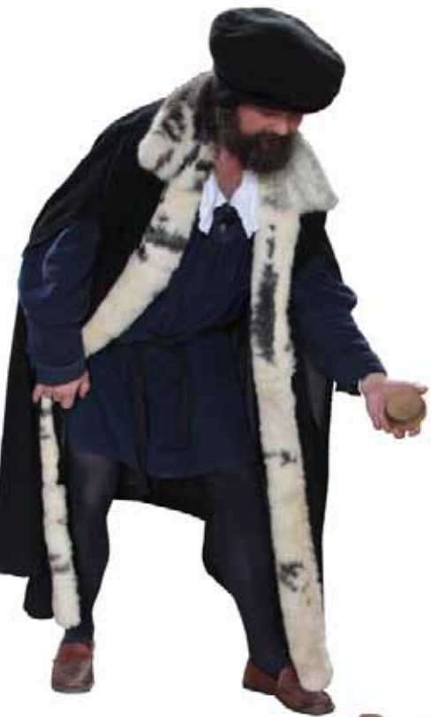
Kugelspiel nach Cusanus